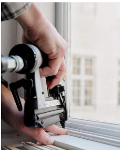
19 Listerne fastgøres med stiftepistol