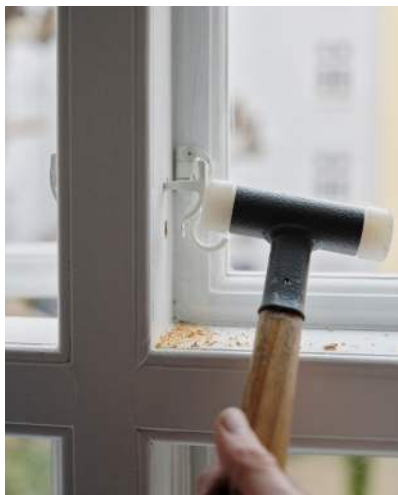
16 Stjerthager og søm bankes i med en bolsjehammer