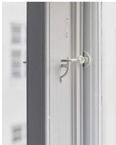
17 Anverferen skrues længere ind efter behov, så vinduesrammen når falsen