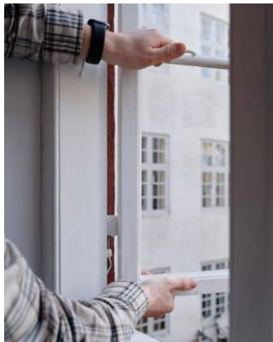
2 Vinduet løftes af og lægges på et bord eller lignende