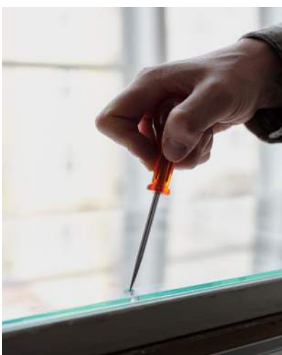
4 Optoglasset oplægges på vinduesrammen og der afmærkes med syl midt i hullerne