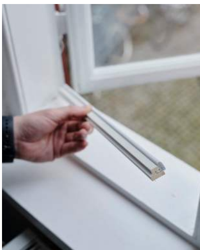
18 Listerne tilskæres i begge ender i 45° gering (de lodrette 1-2 mm for lange)