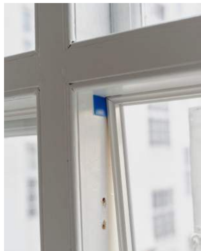
20 Listerne kan klodses ud efter behov med 1 mm brikker for at tætte samlinger