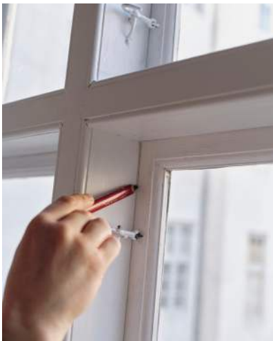
1 Vinduets hjørner afmærkes med tynd blyantstreg