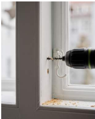
15 Der forbores i karm med 4 mm bor