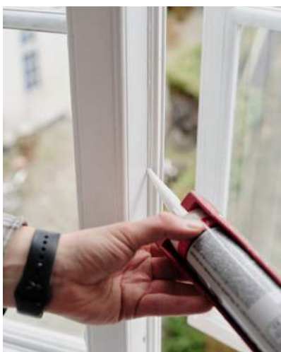
21 Der fuges med akryl omkring listerne