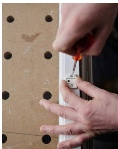
5 Huller i hængsler og 3-huls beslag afmærkes med syl