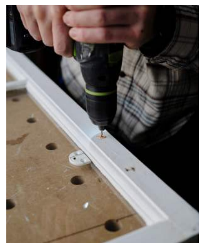
6 Der forbores med 2,5 mm bor